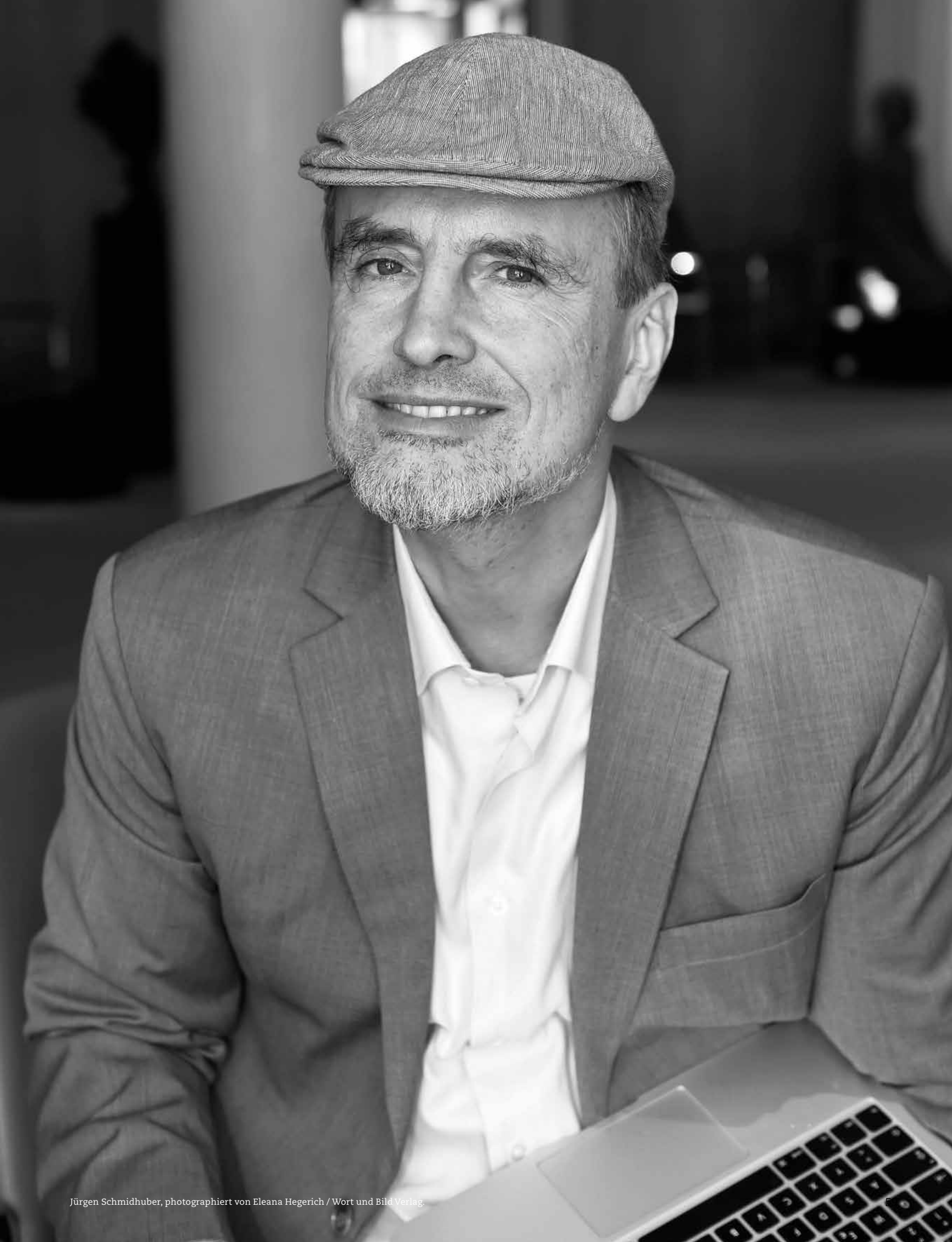
Jürgen Schmidhuber