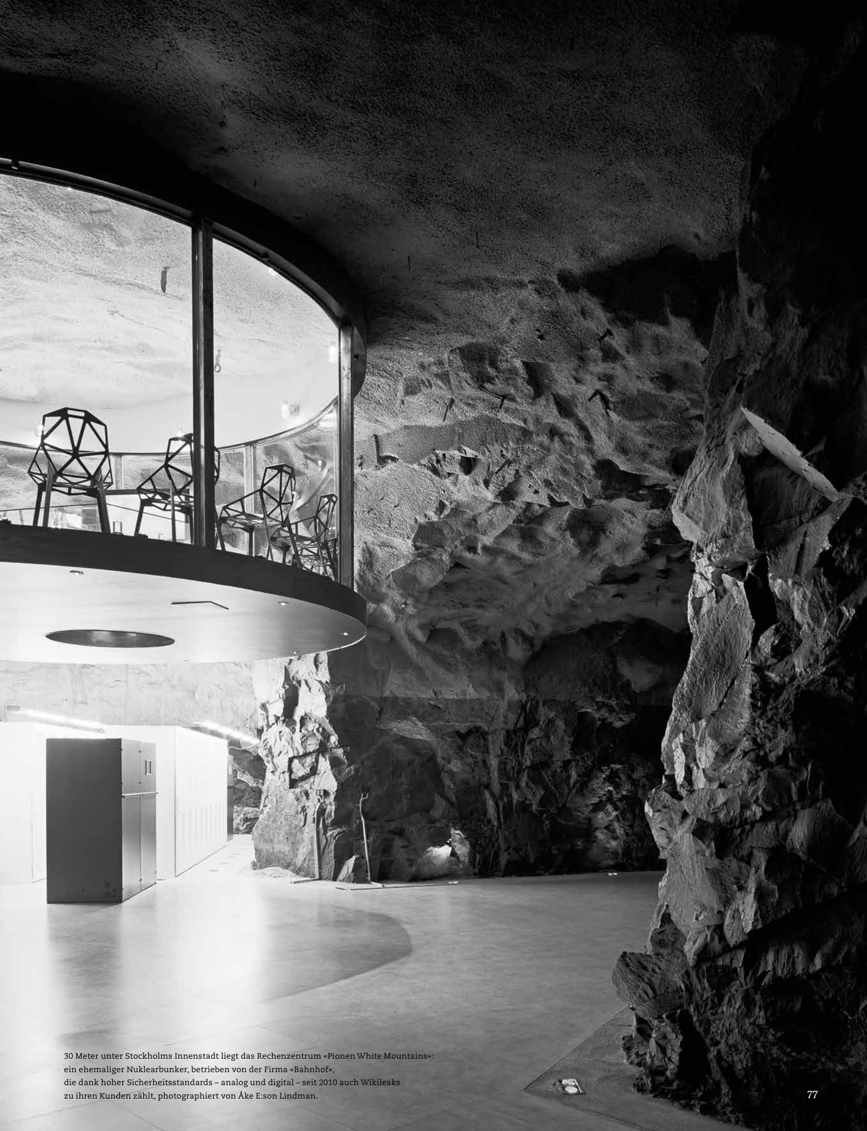
30 Meter unter Stockholms Innenstadt liegt das Rechenzentrum «Pionen White Mountains»: ein ehemaliger Nuklearbunker, betrieben von der Firma «Bahnhof», die dank hoher Sicherheitsstandards – analog und digital – seit 2010 auch Wikileaks zu ihren Kunden zählt, fotografiert von Åke E:son Lindman.