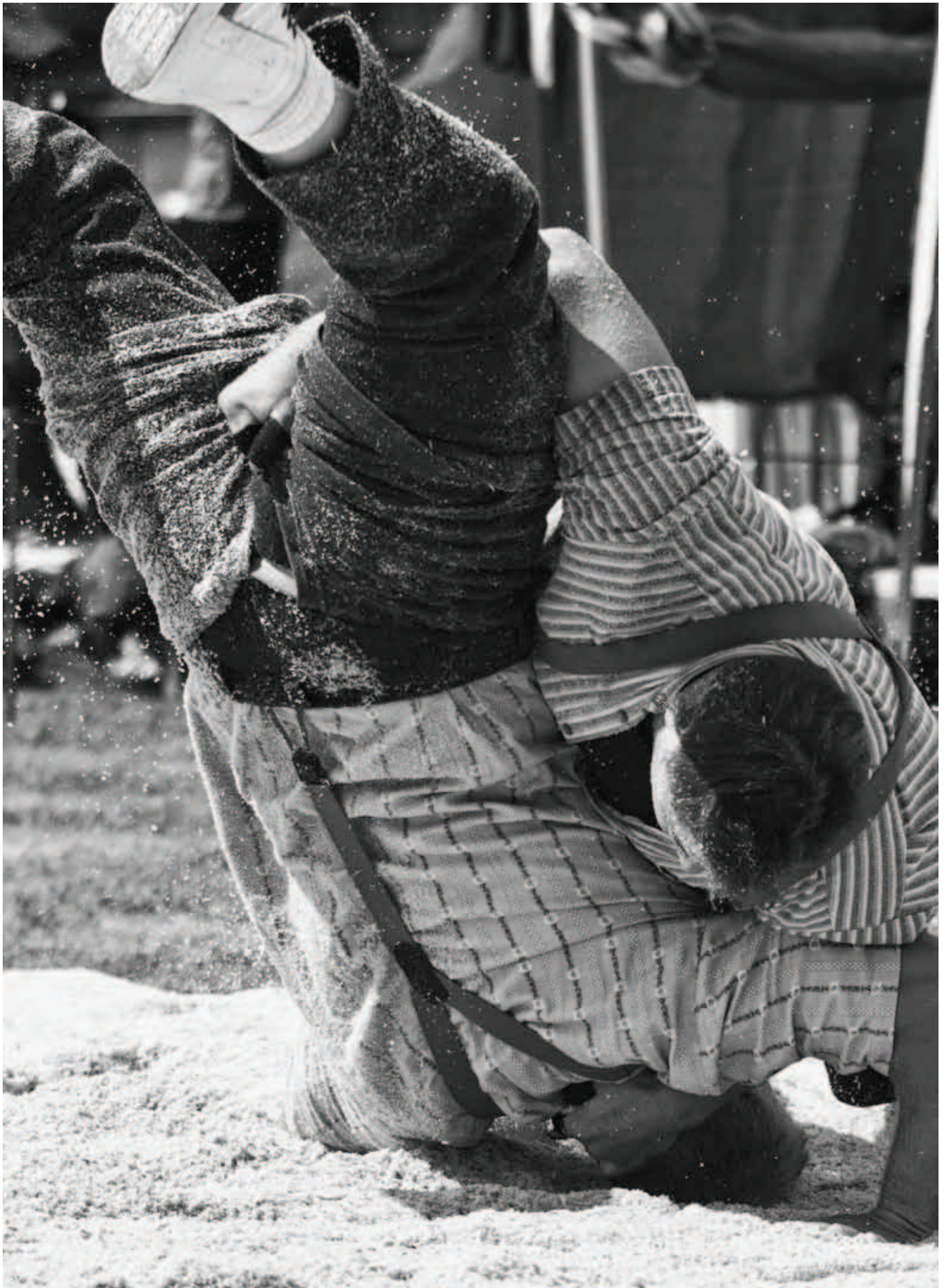
Was haben Schweizer Schwinger zu bieten, wenn Ausländer zu schwingen beginnen?